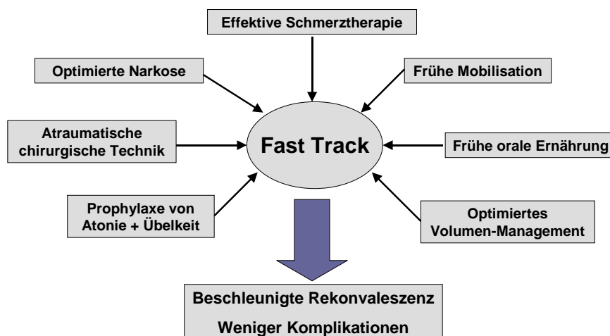
Abbildung 1: Konzept der Fast-Track-Chirurgie

Ein seit Ende der 1990er Jahre eingeführtes Konzept ist das sog. Fast-Track-Verfahren, das von dem dänischen Arzt Hendrik Kehlet entwickelt wurde. Diesem Verfahren liegt das Grundprinzip zugrunde, den durch die Operation verursachten physiologischen und psychologischen Stress zu minimieren, so dass der Patient schnell wieder in seinen normalen Tagesablauf findet 55 . Dabei kommt der postoperativen Schmerztherapie eine gewichtige Rolle zu.